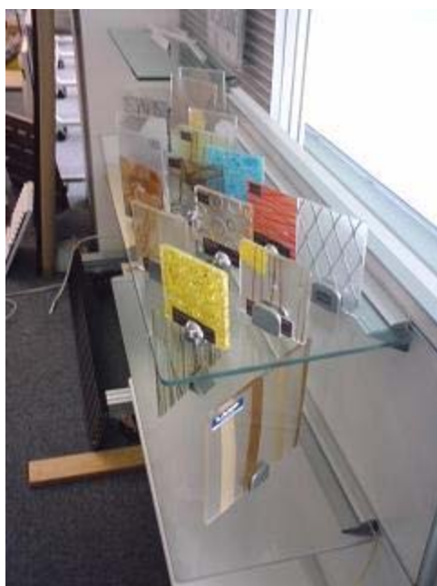
16枚の展示品の内 8枚にミュージアムジェルを付ける