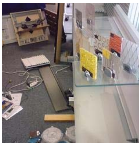
ミュージアムジェルを付けた8枚は、 落下せず。 付けてなかった物は落下