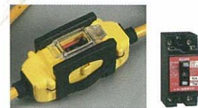
耐衝撃プロテクター付