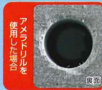
アムロドリルを使用した場合