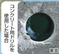
コンクリート用ドリルを使用した場合